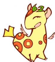
個人住民税PRキャラクター ぜいきりん