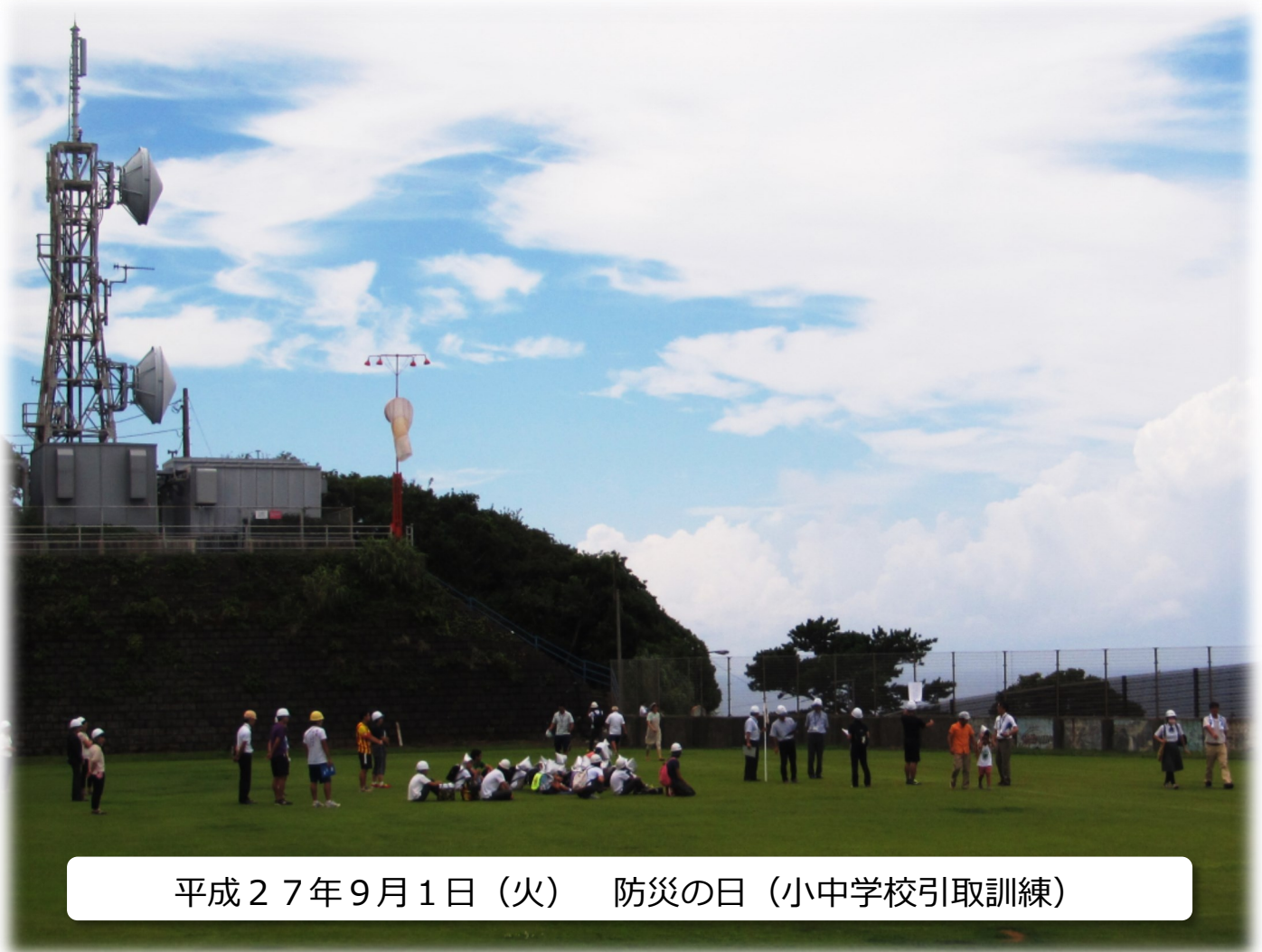
平成27年9月1日(火) 防災の日(小中学校引取訓練)