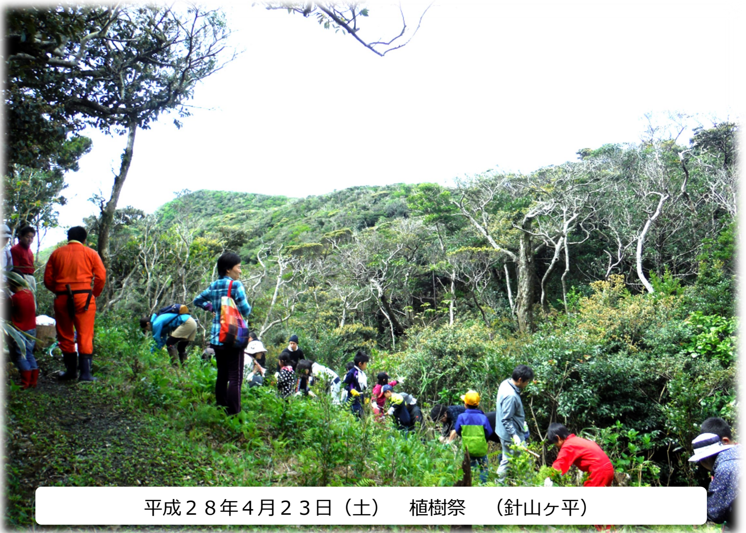
平成28年4月23日(土) 植樹祭 (針山ヶ平)