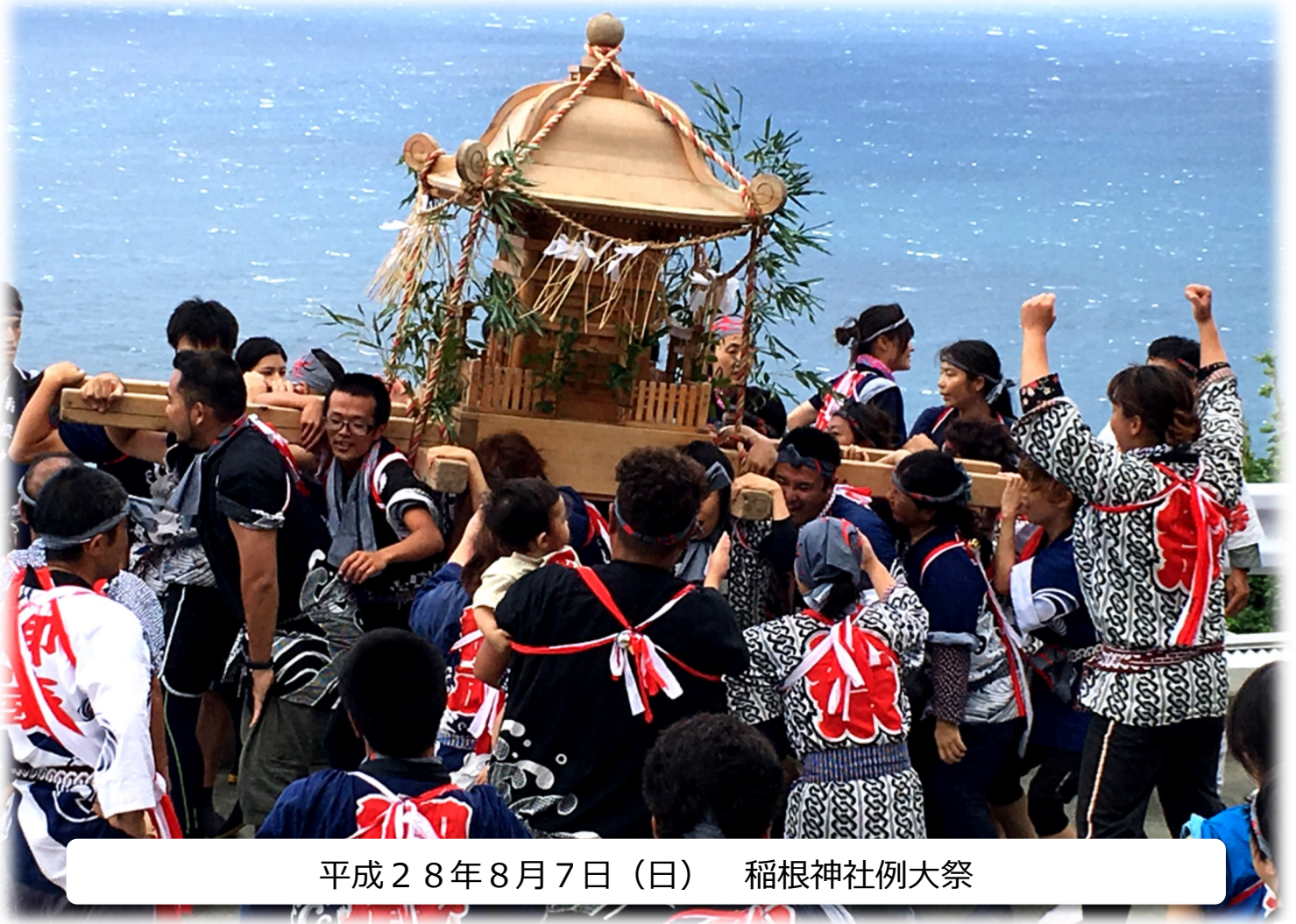
平成28年8月7日（日） 稲根神社例大祭