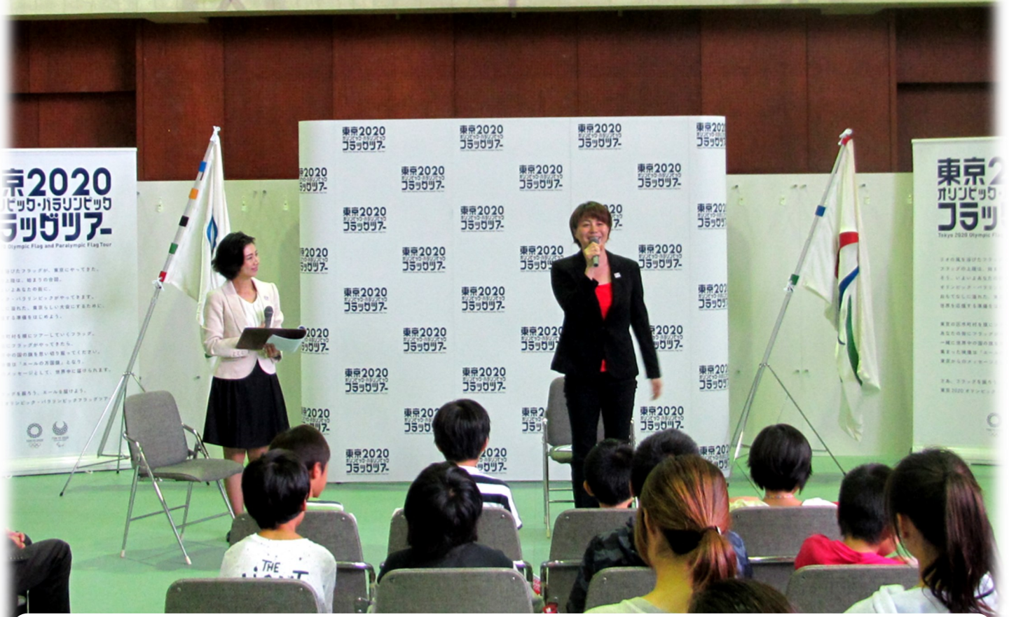
平成28年10月29日（土）オリンピック・パラリンピックフラッグツアー アンバサダー・中村真衣さん（シドニー五輪100m背泳ぎ銀メダル）