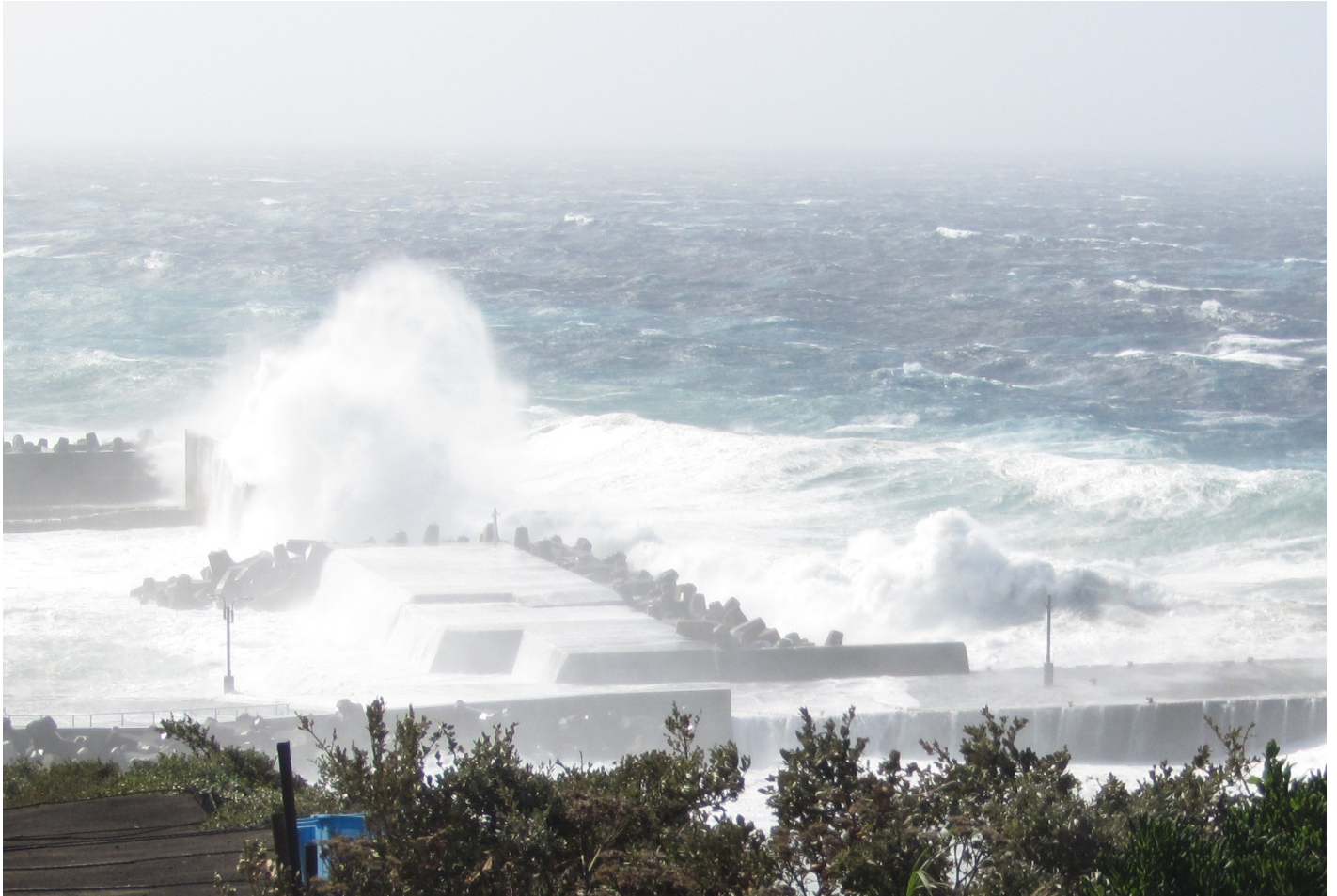
平成29年10月23日(月) 台風21号通過