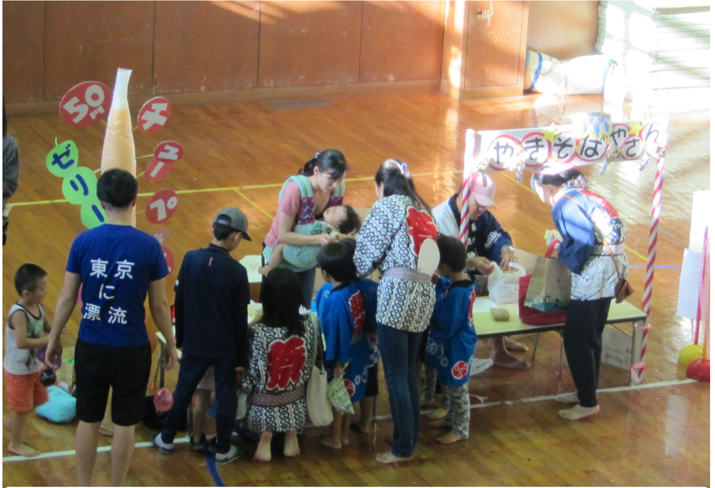
こども縁日 (平成30年6月17日)