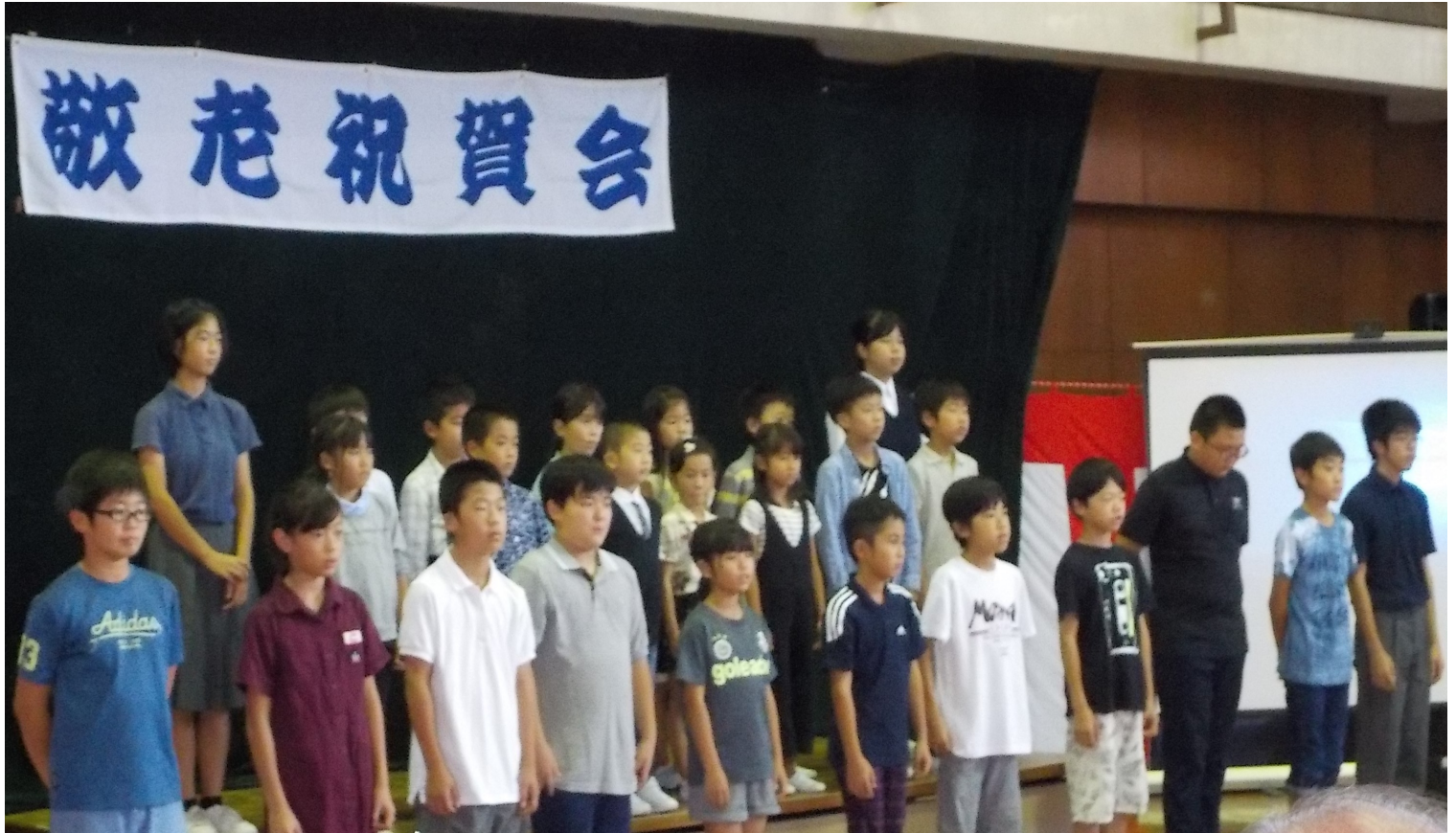
9月30日(日) 敬老祝賀会