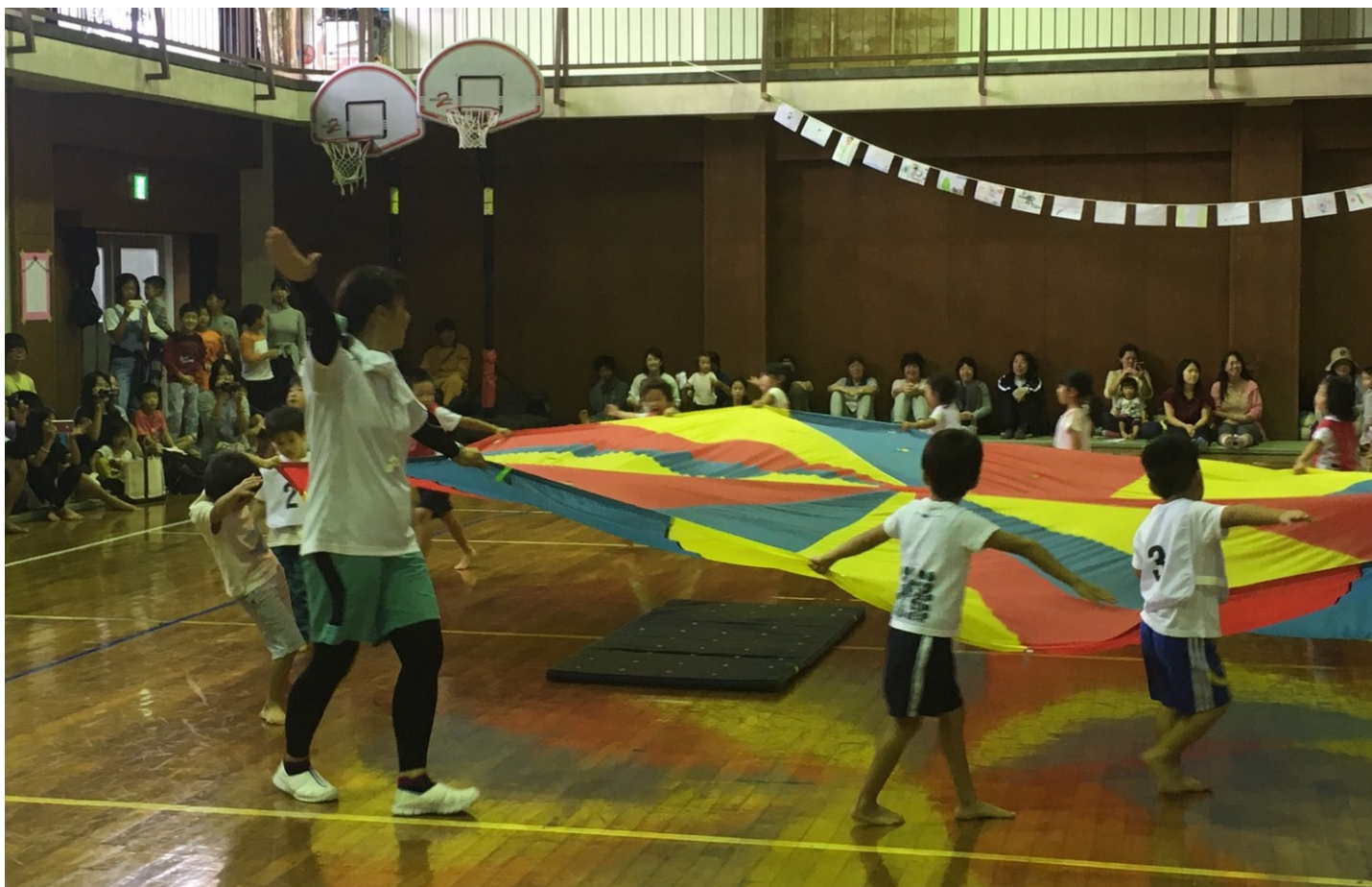
平成30年10月13日(土) 保育園運動会