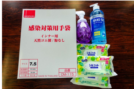
手袋・除菌シート・アルコール