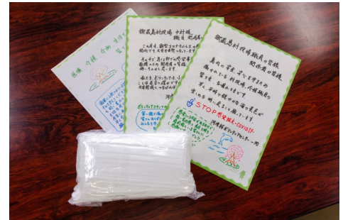
マスク・応援メッセージ