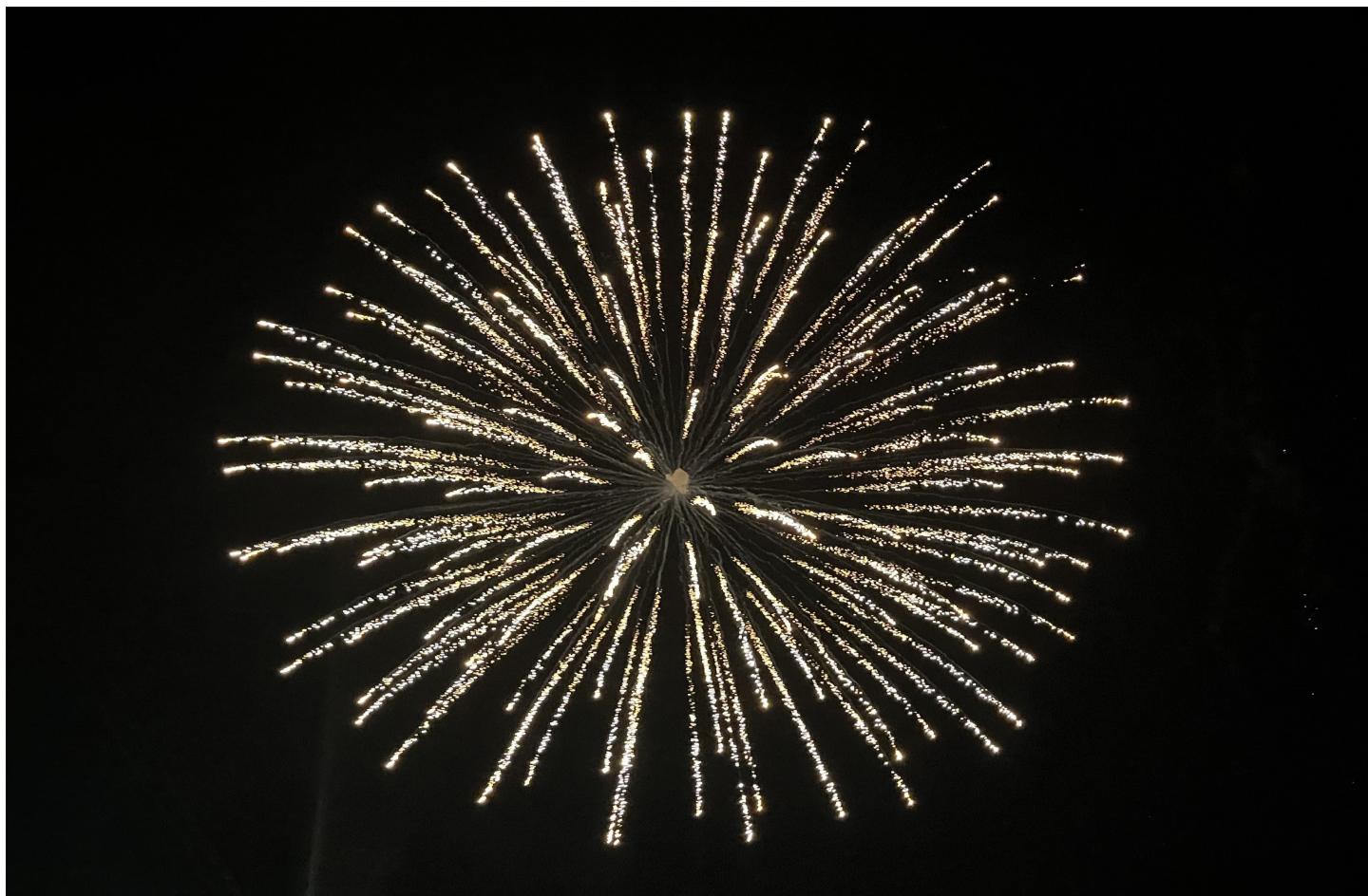
8月3日実施 花火大会の様子